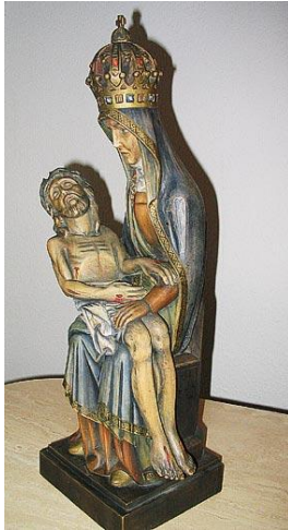
Abbild: Maria-Telgte b. Münster

Bis zur Renovierung im Jahre 1976 hatte die Pieta einen festen Platz in der Antonius-Kirche, danach verschwand sie. Aufbewahrt wird sie zur Zeit in einem Schrank. Zu hoffen bleibt, dass diese schöne Plastik eines Tages ihren Platz in der Antonius-Kirche finden wird.