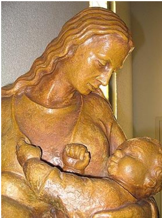
Maria mit Jesuskind (Gips-Plastik)