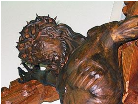
Ausschnitt vom Jesus-Korpus

Der sensible Betrachter kann die Schmerzen des Gekreuzigten förmlich spüren: