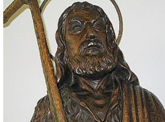
Johannes der Täufer