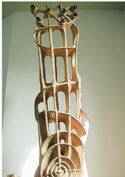
Die sieben Sterne

Die biblische Zahl sieben zieht sich durch die gesamte Tabernakelgestaltung. Im oberen Teil der Stele schwingt sich eine Form entgegen, „einem Engel gleich oder einem kosmischen Saiteninstrumentes, wobei die Durchbrüche Saiten assoziieren könnten, die in einer großen Spirale ausklingen, einer Spirale, die Symbol allen Lebens bedeutet.“ Die Spirale, so die Künstlerin, als „bekrönende Engelform, endet im oberen Teil in Sternenformen, denen die sieben kleinen blauen Farbglasbrocken eine Antwort geben in der Siebenzahl der auf dem Mittelteil des Tabernakelschreines angebrachten großen kostbar gefassten