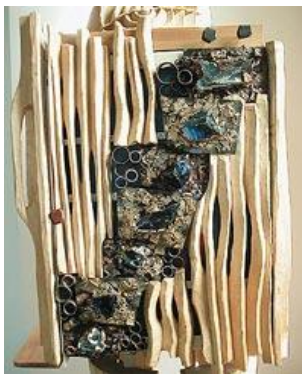
Heiliger Boden: die Flammen am Tabernakel

„Dort erschien ihm der Engel des Herrn in einer Flamme, die aus einem Dornbusch emporschlug. Er (Mose) schaute hin. Da brannte der Dornbusch und verbrannte doch nicht. Mose sagte: Ich will dorthin gehen und mir die außergewöhnliche Erscheinung ansehen. Warum verbrennt denn der Dornbusch nicht? Als der Herr sah, dass Mose näher kam, um sich das anzusehen, rief