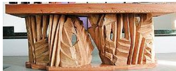
„Formen felsigen Gesteins“: der Altar

Entsprechend knapp skizziert die Greizerin den Altar. Es „sind Formen aus felsigem Gestein entnommen, die den harten,