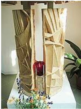
Hände tragen das Allerheiligste

Brot, der Leib des Herrn Fels in der Brandung des Lebens ist.