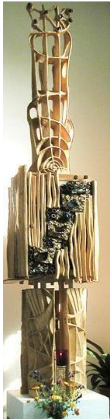
Der Tabernakel im Ganzen

Besonders auffällig gestaltete Nahmmacher die sieben kostbar gefassten Edelglasbrocken am Tabernakelschrein, wo ihren Ausführungen nach „edel bestenfalls im Sinne unserer heutigen Zeit mit anders gearteten Wertigkeitsbegriffen zu verstehen ist. Wurde in früheren Zeiten für den Kirchenraum nur das aus der Natur Entnommene für „edel“