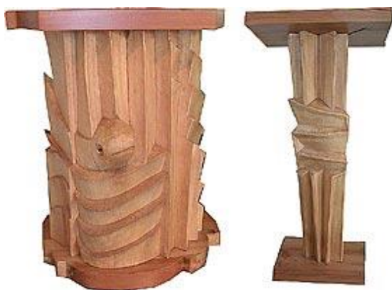
Unterbau der Marienstatue und Ambo