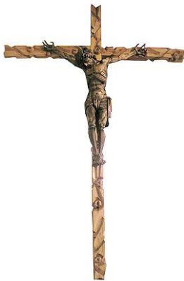
Blickfang in unserer Kirche: Das Kreuz